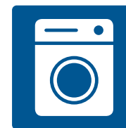
Elektrogroßgeräte (z.B. Waschmaschine, Kühlschrank etc.)