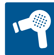
Elektrokleingeräte können auch in der Wertstofftonne entsorgt werden.